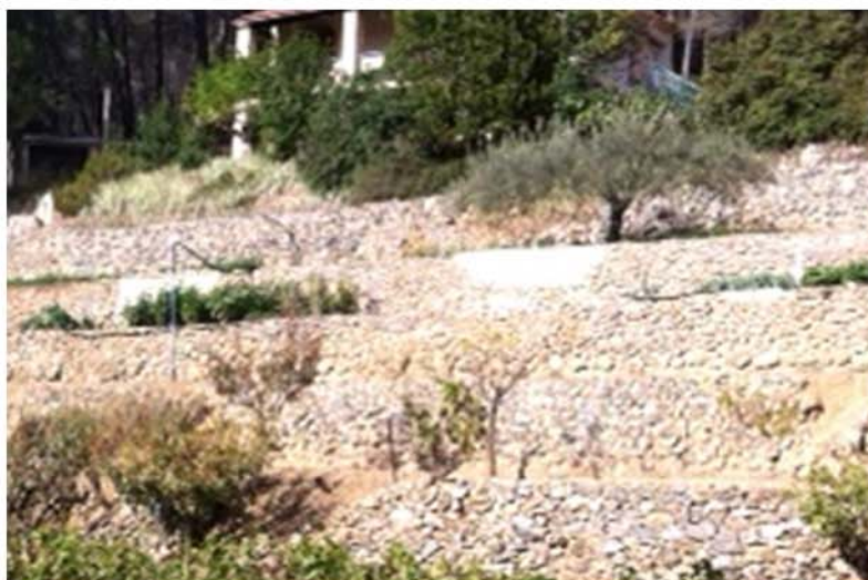
Enrochement, faisant office de mur de soutènement (zones à fort dénivelé) 5 à 6 t de rocher au m2