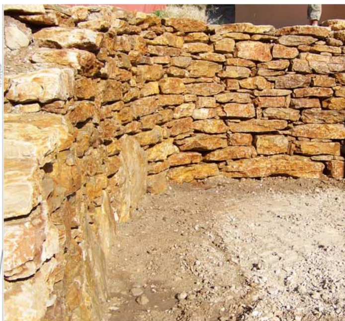
Restanques avec moyet et faible dénivelé, ayant une vocation décorative, (2, 5 tonnes de rocher par m2)